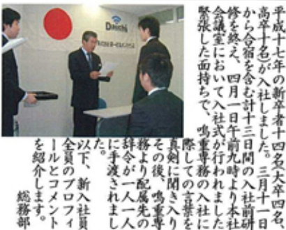
平成十七年の新卒者十四名大卒四名、高卒十名が入社しました。三月十一日から合宿を含む十三日間の入社前研修を終え、四月一日午前九時より本社会議室において入社式が行われました。緊張した面持ちで、鳴響事務の入社に際しての言葉を、真剣に聞き入り、その後、鳴響事務の各部署の先輩社員が一人一人に手渡されました。以下、新入社員全員のプロフィールとコメントをご紹介します。総務部