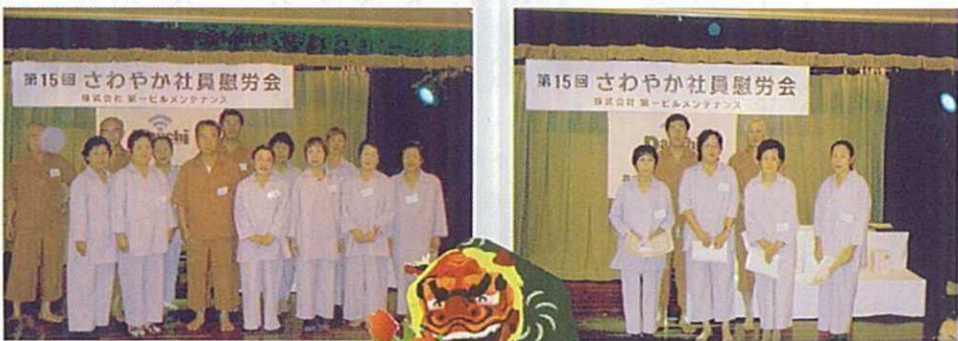
永年勤続表彰された皆さん