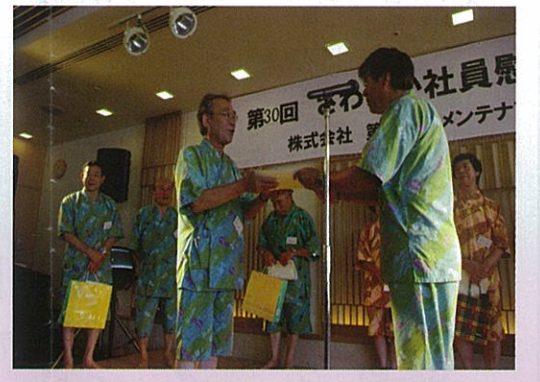
おめでとうございます