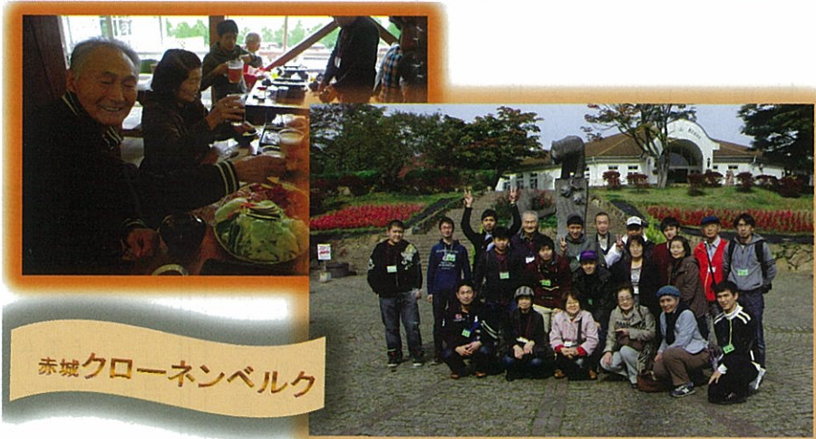
赤城クローネンベルク

今回は、群馬県の赤城クローネンベルクに行ってきました。牧場型テーマパークということで普段はなかなか行けないような所で自然とふれあい、行き帰りのバスの中ではビンゴやカラオケなど企画を用意させていただきました。皆さん楽しんでいただきました。 参加していただいたさわやか社員皆さんは、大変お元気で、おもてなしをした私たちのほうが逆に活力をもらい明日からもっと頑張ろうという気持ちになりました。