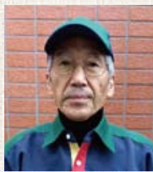
神奈川支店 川崎サイトシティ 三角 四雄

依頼事項に対していつも快く対応して下さり、誰に対しても心地よい対応で、お客様や管理人さんからも褒めの言葉を頂いております。